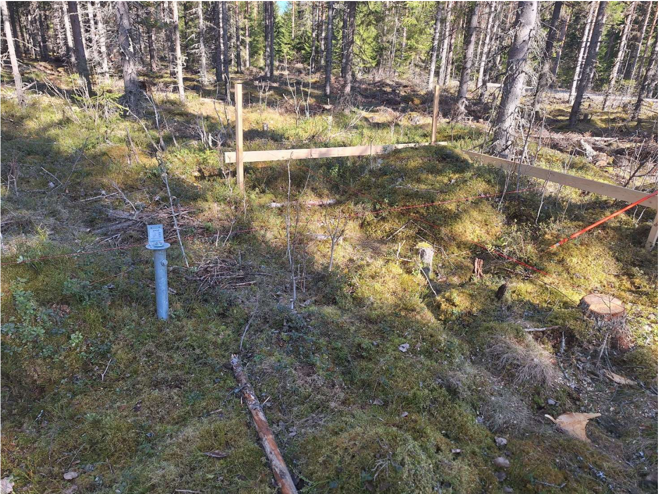
Rakennuksen sokkelilinjalle on asennettu ruuvipaalu

Rakennustyön aloittamisesta on myös ilmoitettu asianmukaisesti rakennuspaikan viereen asennetulla kyltillä.