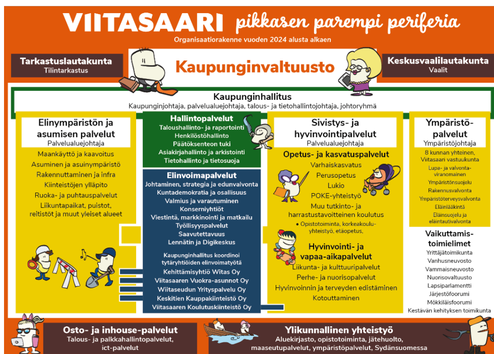
Kuva 2. Viitasaaren kaupungin organisaatiokaavio.