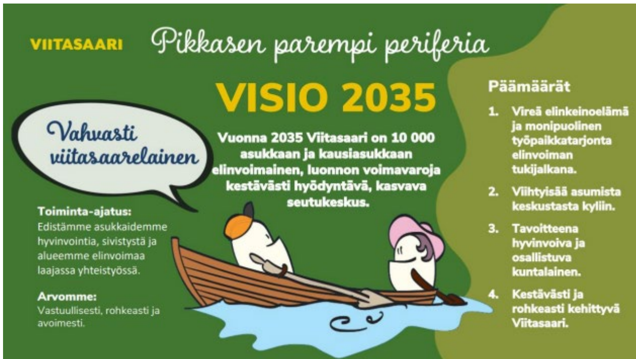
Kuva 1. Viitasaaren kaupunkistrategia 2022–2026.

Talousarvion 2025 mukaan kaupunkistrategia tullaan päivittämään vuoden 2026 aikana siten, että sen pohjalta on rakennettavissa tavoitteet vuoden 2027 talousarvioon.