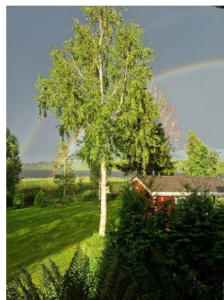
Kuva 9. Sateenkaarimaisema Ylä-Keiteleen yllä.

Kestävän kehityksen toimikunta vastaa kes- tävän kehityksen teemojen jalkauttamisesta kaupungin toimintaan.