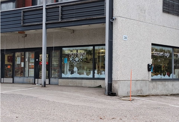
Kuvat 5 ja 6. Tuunari-paja, Keskitie 30, Viitasaari

prosentin työajalla ja tämän lisäksi yksi kokaikainen työpajaohjaaja.