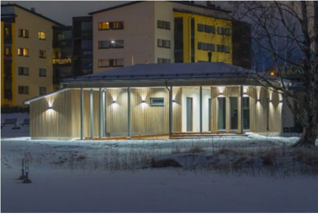
Kuva 4. Porthanin uusi huoltorakennus.

Tarkastuslautakunta pitää tärkeänä sekä Sydän-Suomen kuntien että Seutukaupunkien kanssa tehtävän yhteistyön. Kaupunki on tehnyt hyvää edunvalvontatyötä maakunnallisella ja valtakunnallisella tasolla. Monipuolinen vaikuttaminen ja verkostoituminen on kaupungin edunvalvonnan kannalta ensiarvoisen tärkeää.