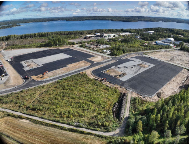
Kuva 10. Wiilon yrityspuiston aluetta.

Logistiikkakeskus Wiilo oli hankkeen alkuperäinen nimi. Kun osoittautui, että logistiikkakeskus ei toteudu, aluetta kutsutaan ja markkinoidaan nimellä "Wiilo yrityspuisto".