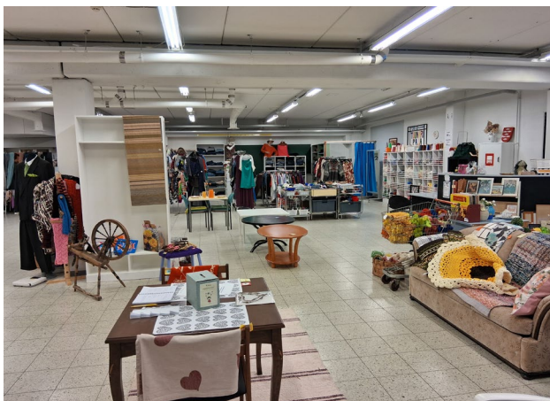
Kuvat 7 ja 8. Tuunari-paja, sisäkuvia