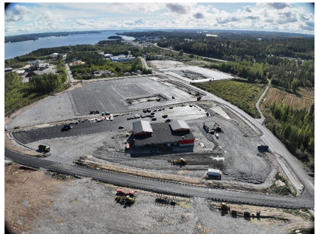
Kuva 3. Wiilon alue.

Viitasaaren kaupungin elinvoimapalvelualueiden vastuualueisiin kuuluvat Johtaminen, strategia ja edunvalvonta, kuntademokratia ja osallisuus, valmius ja varautuminen konserniyhtiöt, viestintä, markkinointi ja matkailu, työllisyyspalvelut, saavutettavuus sekä lennätin ja Digikeskus. Elinvoimapalveluiden palvelualueen vastuullinen toimielin on kaupunginhallitus.